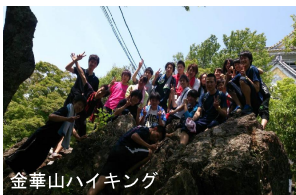
金華山ハイキング