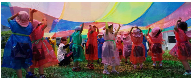
岐阜大学教育学部美術教育講座