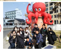
地理学野外実習I(2年次) 日間賀島