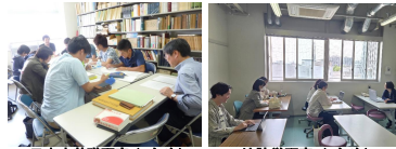
日本史基礎研究I(3年次)