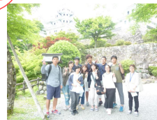
学生どうしや教員との 絆を深めます