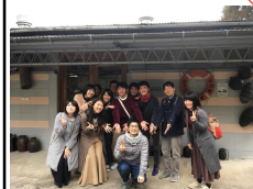
法学研究II(3年次) 水俣病歴史考証館