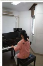
グランドピアノ練習室 2階 5室