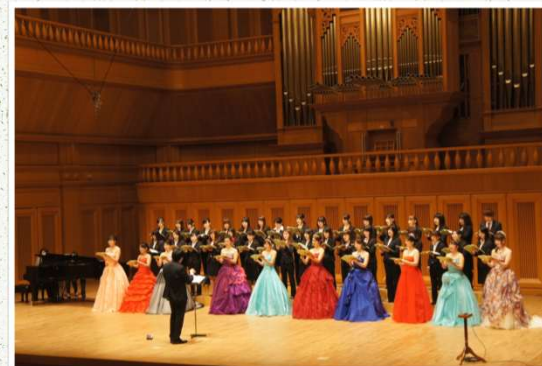
卒業記念演奏会 最後の全体合唱 サラマンカホール