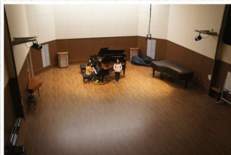
大合奏室 (E135室) 平成28年耐震改修工事