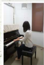
電子ピアノ、アップライト ピアノ練習室 1階 24室 2階 18室