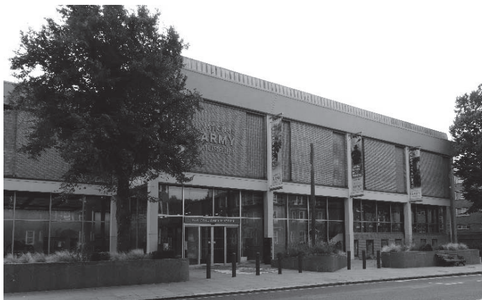
2017年3月にリニューアルオープンしたNAM

実は、筆者はリニューアル前のNAMを一度訪れたことがある。2000年代半ば、大学院生として英国で留学を始めたばかりの時に、自分の研究テーマに関連する博物館ということで大いに期待して出かけたことを覚えている。ただ期待に反して、展示内容に特別に心を引かれたり感銘を受けたりすることはなかった。必ずしも細部まで見て回ったわけではなく、したがって今となっては大雑把な印象しか残っていないのだが、武器・兵器、軍服や軍旗といった昔ながらの軍事史をなぞるような展示物を見ながら、英国陸軍の歴史をクロノロジカルに (発展史的に) 辿っていく内容であったように記憶している。それは、21世紀の開始とともに研究の門をくぐり、それ以来「新しい軍事史」という潮流の中に身を置いてきた筆者にはひどく物足りなく (視野が狭すぎるように) 感じられた 5 。今回、NAMを再訪した理由は、以上の経験を下敷きにして、上記の大改装を経て展示の内容と方法がどのように変わったのかを検証し、その背景についても併せて考察してみたいと考えたからであった。