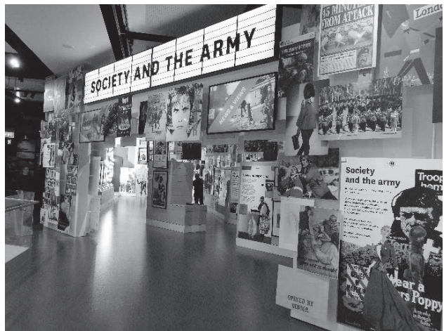
「社会」ギャラリー入口

一方、新NAMにおける展示の新しさを最も強く感じられるのが「社会」ギャラリーである。ここでテーマとされているのは「社会と不可分の存在としての陸軍」であり、両者の結びつきと影響関係がさまざまな観点から検討されている。注目すべきは、「(市民社会における) 駐屯」「報道・検閲」「真実・フィクション」「追悼・記憶」「チャリティ」などの比較的よく知られた（「かための」）問題と並んで、私たちの生活に直接関わる（「ゆるめの」）トピックが積極的に取り上げられていることである。たとえば、「ことば」「音楽」「ファッション」「玩具」などを事例として、市民