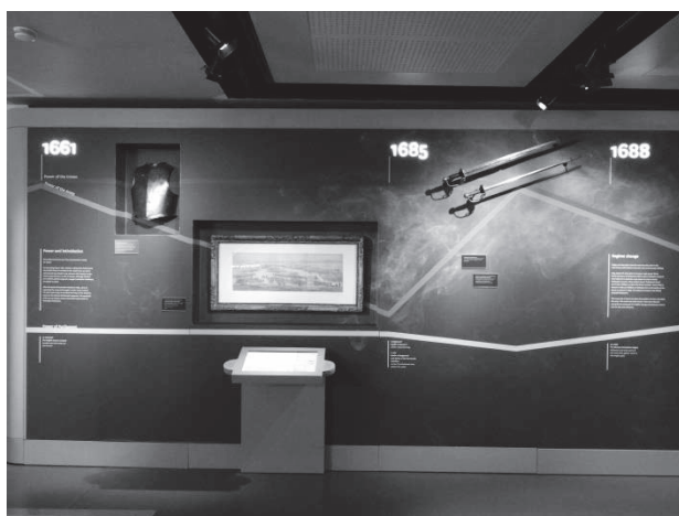
「陸軍」ギャラリー [陸軍の成立過程についての展示]

「王権の力」「議会の力」「陸軍の力」の推移を壁面に折れ線グラフで示すことで（縦軸は力の強弱、横軸は時間の推移〔1642年から90年まで〕を表す）、シンプルかつ説得的な説明を行うことに成功している。折れ線を除くと、壁面には「折れ」の部分（転換点）に該当する年号・事件の記載と、事件に関する簡単な説明が書き込まれているだけであるが（関連する絵画・武具などの展示はあり）、グラフと合わせて見ることで、英国陸軍が王権と議会の対立・交渉・融和の中で成立した経緯が的確に跡づけられている（1689年に3つの線は合流し、以後1本の線となる） 10 。本ギャラリーでは他に、戦争と結びついて形成されてきた陸軍の伝統・アイデンティ