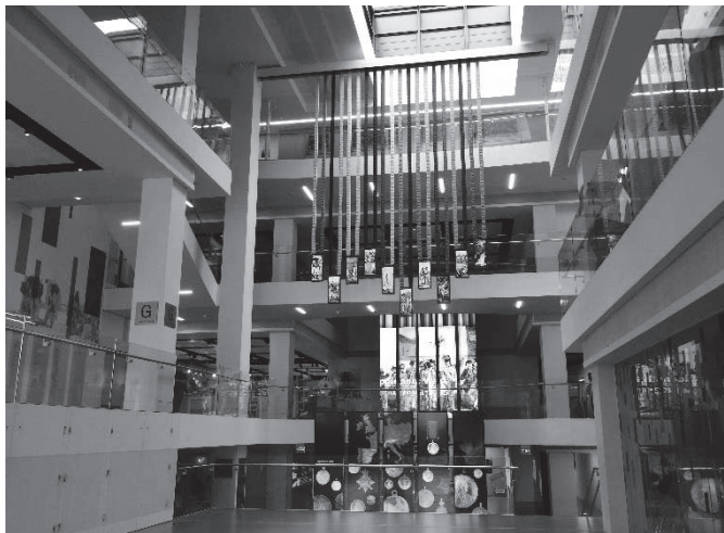
館内中央の広い中空スペース

ここに端的に説明されているように、NAMの大改装の目的は、開館から40年余りが経過してすでに時代遅れとなっていた展示の内容・方法を根本的に見直し、現在の人々の趣味・関心に合ったものの一から作り替えることにあった。この目的は、まず何よりも新博物館の構造に反映されている。展示の具体的な内容については次章に譲るとして、まずは博物館全体の作りについて見ておこう。