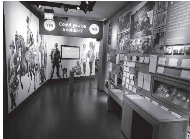
「軍人」ギャラリー（出口部分）

こうした姿勢は、新NAMの展示の至るところに見られる。たとえば「軍人」ギャラリーでは、見学者に「あなたは軍人になることができるでしょうか？」と問いかけることから展示が始まる。こうして見学者は、この問いを自分に投げかけながら、過去と現在の軍人の経験に触れていくことになる。そしてすべての展示を見終えた後に、再び出口において同様の質問が投げかけられるのである。出口付近にはまた、「軍人とその勤務について、あなたはどのように考えるか？」という問いかけと、それに対する回答を用紙に記入し掲示するスペースがあり、見学者は展示内容を踏まえて