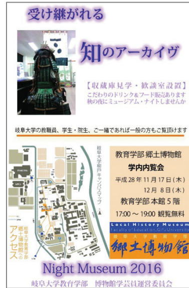
図 5. 同年 内覧会「ナイト・ミュージアム」広報用チラシ