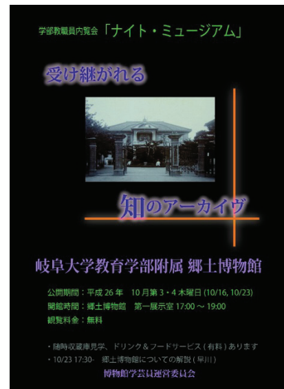
図 1. 2014 年 内覧会「ナイト・ミュージアム」広報用チラシ