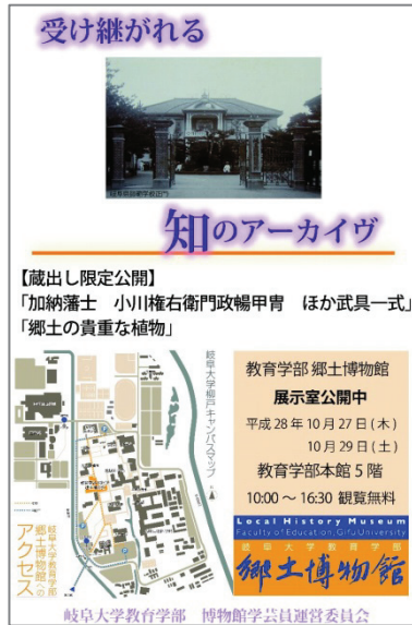
図 4. 2016 年 岐大祭広報用チラシ