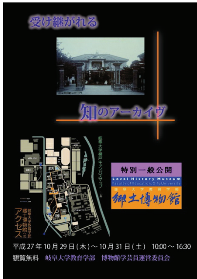
図 2. 2015 年岐大祭広報用チラシ