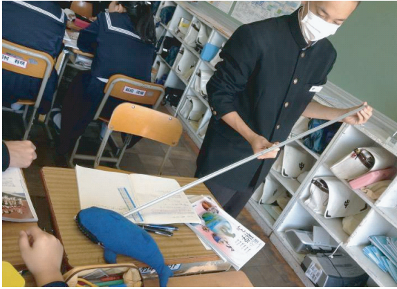
図2. 実験を行う生徒.

働いているのか」とした。その後、個人個人で実験を行って現象を追試したあと、物体にはたらいている力について考え、班で交流を促した(図2)。