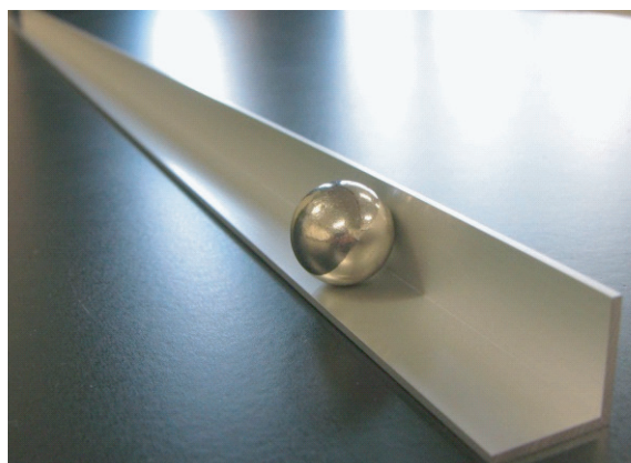
図1. ネオジウム磁石ボール型(φ20)と等辺アルミニウムアングル。

本研究では、いくつかのネオジウム磁石を用意した。一つは、直径5ミリメートル、長さ5mmの円筒形の希土類マグネット(KN-3)、磁束密度は4000ガウスである。円筒形のため、棒磁石のような磁場をもつが、斜面を転がりながら下る際に、速度はほぼ一定に保たれているようにみえるが、転がし方によっては動きが不安定になる。直径20mmボール型6850ガウスの磁石(ネオジウム磁石(N40)、ボール型)では、地球磁場のような磁場をもつが、磁極が見た目に分かりにくい。球形のため、運動速度が一定になってからは動きは安定している。斜面における等速直線運動には、アルミ製の等辺アングル15mm×15mm×1000mmを使用した(図1)。