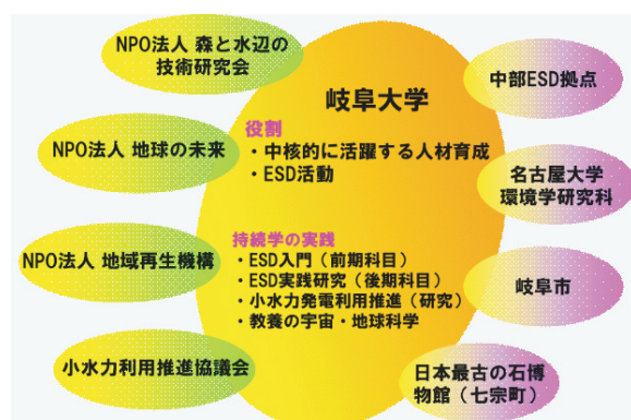
図1. 岐阜ブランチの組織図（24年度）。

平成20年より中部ESD拠点の岐阜ブランチが発足し、市民団体やNPO役員、教育関係者による定期的な会合が岐阜大学内で開かれていた。こうした話し合いのなかで、大学とNPO法人、地方自治体や周辺大学との連携の枠組みが形成された（図1）。