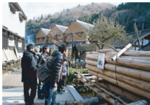
図8. エクスカージョンの様子。