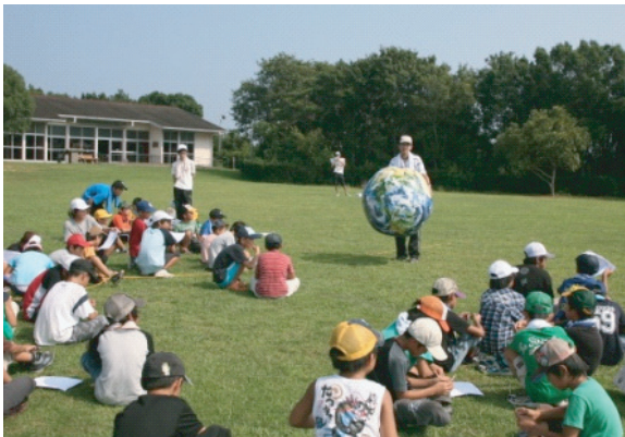
図3. レクリエーション.

例年100名近い小中学生が参加するため、当サークルは、参加者とのアイスブレイクを兼ねたレクリエーション（図3）を企画・運営するほか、活動班では中学生のリーダーを補助する班スタッフとして各活動での安全管理（図4）や全体の円滑な運営に貢献している。