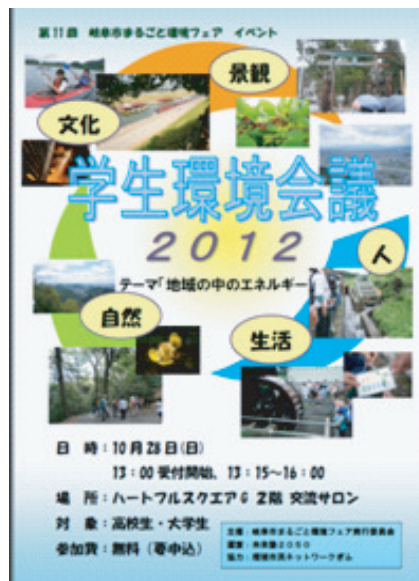
図6. 学生環境会議チラシ。

会議後は、エクスカージョンとして愛知県豊田市に赴き、木材利用促進の取り組みや木質エネルギーの研究現場を見学した(図8)。現地で暮らしている人々から直接話を聞くことで、便利な技術や設備の導入だけでなく、それを利用する人々のことも考えた、より大きな枠組みでとらえる必要性を改めて感じた。