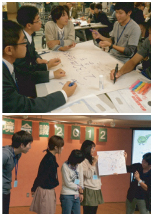
図7. 学生環境会議の様子。