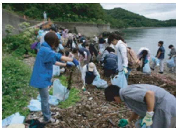
図13. 奈佐の浜清掃活動。