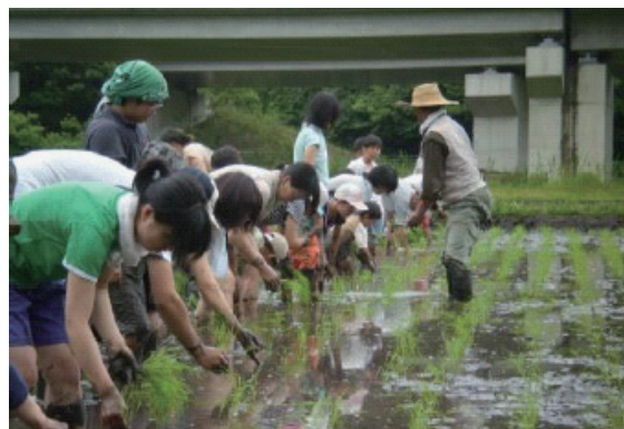
図2. 達目洞・稲作体験。

当サークルも外来種駆除や歩道整備等、保全作業面への参加だけでなく、近隣の幼稚園児や小学生へのガイドや、稲作体験のサポート（図2）など環境教育面でも同会と協働して取り組んでいる。