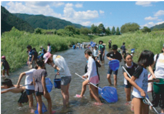
図4. 活動中の安全管理.