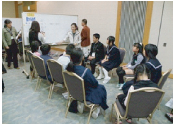
図5. 子ども会議の様子.