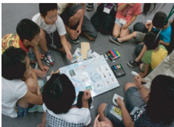
図11. 県民大会ワークショップの様子。

各個人で実行可能な活動には自ずから制限があり，各サークル単体においても同様である。高校生や大学生も，今後，県内外や，「伊勢湾流域」，さらに「伊勢・三河湾流域圏」という広い範囲で交流・連携を深めることで，多様な見方，考え方が生まれ，さらなる活動の発展が期待される。