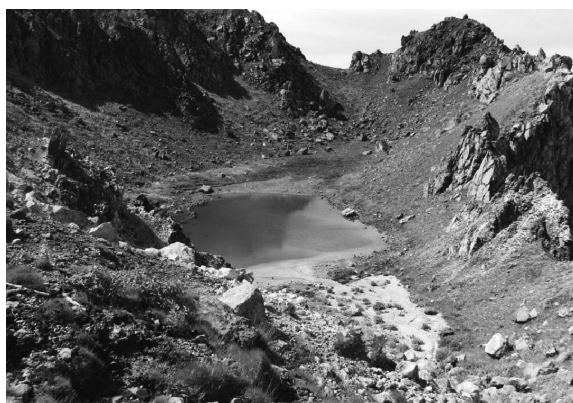
図4. 旧火口(正賀池)の様子。