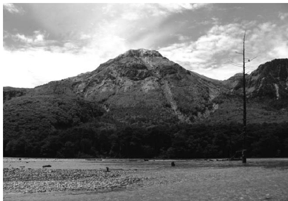
図1. 上高地からみた焼岳と大正池.

山頂部の溶岩ドームでは、現在でも割れ目から活発な噴気活動がみられる。噴気孔の周辺の岩には、黄灰色の硫黄の沈殿物が付着している。焼岳は、輝石、角閃石を含む安山岩～ディサイト質の溶岩、火砕流、泥流堆積物で構成されており、山頂付近は溶岩累層からなる。