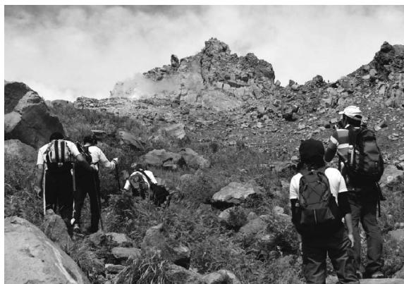
図3. 山頂の溶岩ドーム。