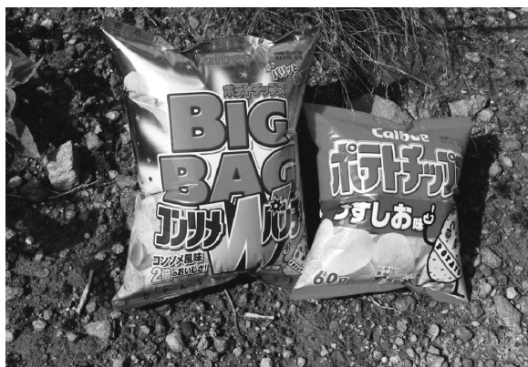
図2. 気圧の低下による菓子袋のふくらみ

中の湯温泉から、中の湯ルートに登り、釜トンネルルートと合流する標高2000m付近までは、ブナやモミを主体する原生林が広がっている。焼岳の山腹には、背の高い樹木はなくなり、ハイマツ、ナナカマドなどの低木が主体となる。さらに、標高2200m付近からは溶岩流でできた巨礫が露出するようになる。こうした自然景観の変化にともなって、気温が下がっていくことや、菓子袋が膨らむこと(図2)を観察し、参加者が交代でレポートし、ビデオカメラに収めた。