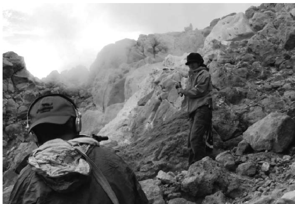
図5. 噴気口前でのロケの様子.