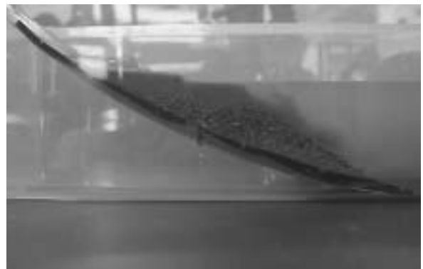
図9 地層をつくる実験でみられた水槽中の土砂の動き

寒天で地層モデルをつくり、ストローでボーリング調査を模擬する授業実践も比較的良好に行われている。今回の授業では、実際に小学校周辺のボーリング調査のデータをもとに地層モデルを作ったこと、ボーリング調査地点を含む広い範囲にわたる地層の広がりについての認識をもたせるため、比較的大きな容器で地層モデルをつくったこと、地層モデルの表面に地形図を張ることや、容器の側面を隠すことで小学校周辺の地下のようすをイメージさせやすい作りになるように工夫した。子どもたちは、ストローで寒天の層をサンプリングする作業を通して地層の広がりをイメージしていき、最後に地層モデルの断面のようすを見せることで、それぞれの子どものイメージをより確かにし、しかも印象に残るような演出をしたことで高い効果をもたらすことができた。大きな容器で