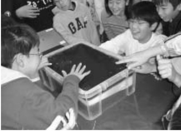
図8 寒天モデルで地層の面的広がりを実感する子どもたち

とき「お～！」とか「先生、すご～い！」といった歓声を上げる子どもたちの姿をみる事ができた(図8)。