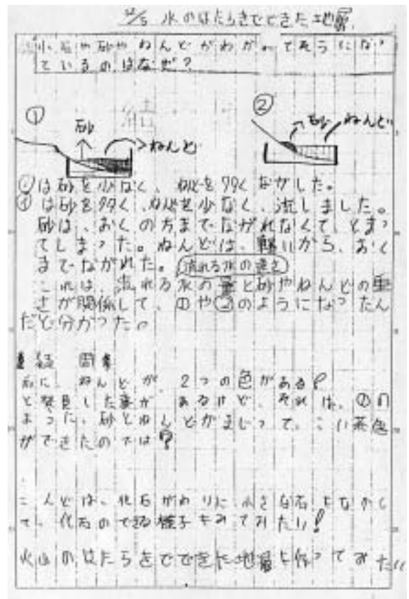
図3 ノートに記録された地層のでき方に関するスケッチの例