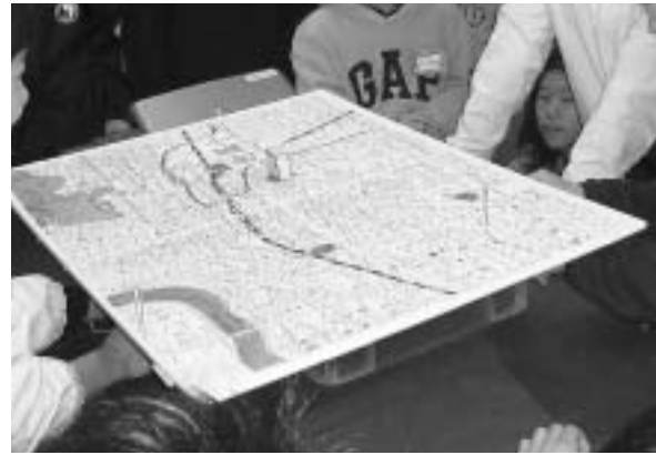
図5 授業で用いた寒天モデル

赤，白，オレンジ色に着色した寒天を順次流し込んで作成した．寒天を流し込むときに容器を傾斜させることで，それぞれの層の厚さが場所ごとに違いがあるようにし，しかも実際のボーリング調査で明らかにされている粘土，砂，礫層の厚さの比と一致するように工夫している．