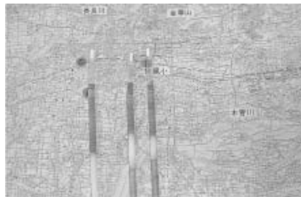
図7 ストローで採集されたコアの断面

子どもたちは，ストローを垂直に突き刺して寒天の地層をボーリング調査地点に対応するところでサンプリングして，地層の重なり方を確認した（図6）続いて小学校の位置にストローを突き刺して，小学校の地下の地層の重なりが予想と合致していることを確かめた（図7）授業のまとめで，寒天モデルの側面の覆いを取り除き，地層がどのように重なっているのかわかるようにした．この