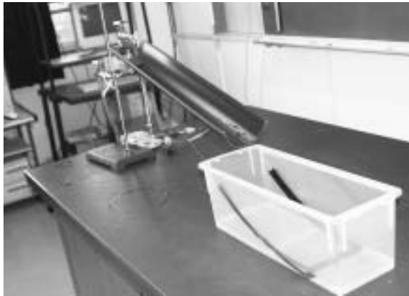
図1 地層をつくる水槽実験装置