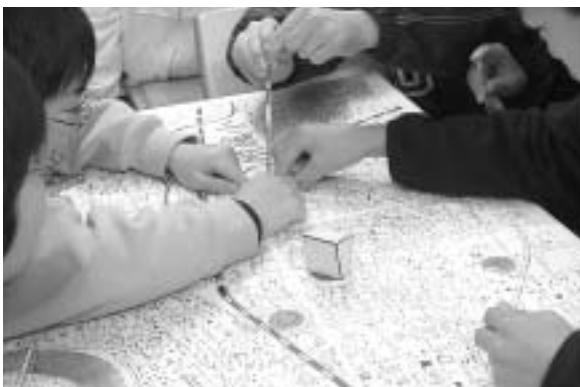
図6 寒天モデルをストローでサンプリングする子供たちの活動

その予想を確かめるために，寒天でつくった地層モデルを用意した（図5）．この地層モデルは長さ47cm，幅32cm，高さ17cmのアクリルの容器に，