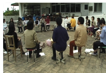
図2 第1回岐阜大学芸術フォーラムにおける「しょうぎ作曲」