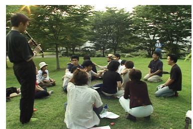
図13 第15回におけるパフォーマンス