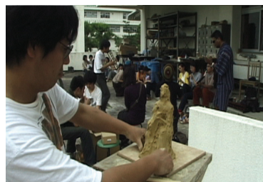
図5 第3回における即興演奏と粘土制作