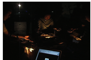
図12 第14回におけるパフォーマンス