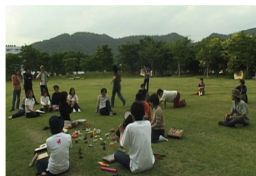
図4 第2回における「しょうぎ作曲」