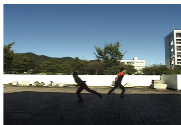
図7 第6回における「モノクロームサーカス」のダンス