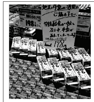
図1 廃棄牛乳販売の様子

休業期間中は、こうしたニュースを学習者と話し合うこともなかった。しかし、牛乳を廃棄したという事実は子どもたちにとって、日常生活に非常にかかわりの深いものだけに切実性があり、その後の牛乳全体の問題を探究するためには有効である。また、その要因が新型コロナウイルスであるということは、子どもたちにとっても共通の突然の休業体験をしているだけに、問題意識を醸成するには適していると考えた。